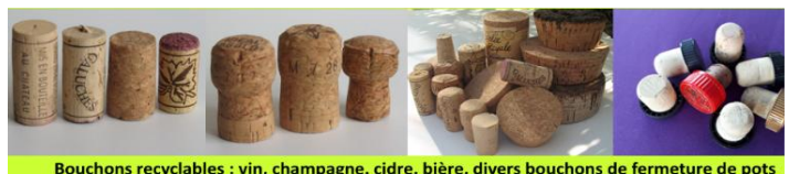
Bouchons recyclables : vin, champagne, cidre, bière, divers bouchons de fermeture de pots

Pour plus d'informations, rendez-vous sur la page Facebook de l'association : Lachaineduliège